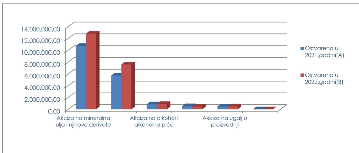
Grafikon 2: Struktura naplaćenih akciza po vrsti akciznih proizvoda

U strukturi naplaćenih akciza najviše su zastupljeni akciza na mineralna ulja i njihove derivate sa 57,48%, zatim akciza na duvanske proizvode sa 34,08%, akciza na alkohol i alkoholna pića sa 4,05%, i akciza na gaziranu vodu 2,17%.